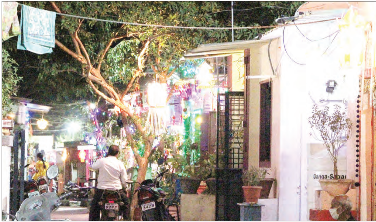
सोलापूर : जुनी मिल चाळीत दीपावलीची पहिली रात्र रंगीबेरंगी आकाशदिवा, दीपमाळांनी असा प्रकाशमान झाला.

पुढील पायावर अर्घ्य देऊन पूजा केली जाते. यावेळी 'सर्वदेवमये देवि सर्वदेवोऽऽरलंकृते । म । ततर्ममाभिलषितं कुरु नंदिनी।' असा मंत्र म्हणून प्रार्थना केली जाते. समुद्र मंथनातून पाच काम धेनू उत्पन्न झाल्या. त्यातल्या नंदा नावाच्या धेनूला उद्देशून हे व्रत केले जाते, अशी माहितीही दाते यांनी दिली.