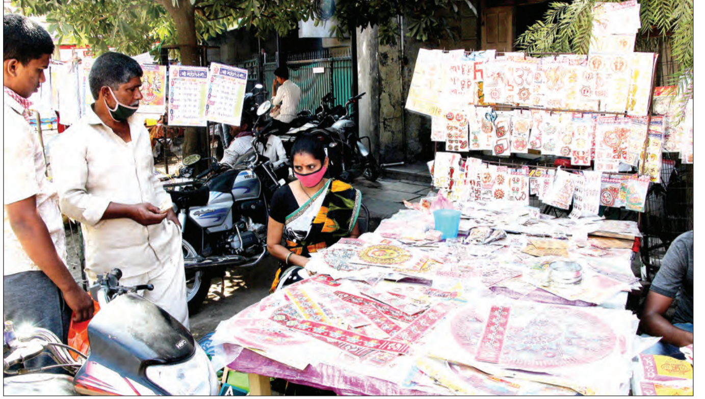
१) दिवाळी म्हणजे फराळ आलाच. अलीकडे तयार फराळाची प्रथा पडली आहे. त्यामुळे हलवाई गल्लीत करंजी, लाडू, चकली, शंकरपाळी आदी पदार्थांनी दुकाने सजली आहेत. २) दीपावलीच्या पार्श्वभूमीवर शुभ-लाभ, रांगोळी आदींच्या स्टीकर्सना मागणी आहे.